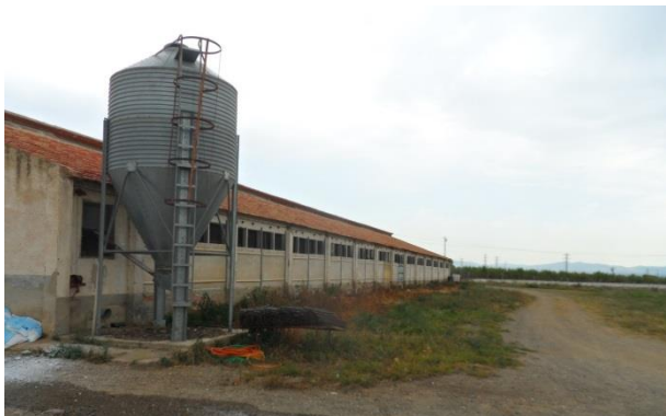
Antes de usar DCal: