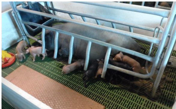
Antes de usar DCal: