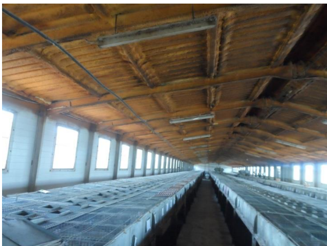
Antes de usar DCal: