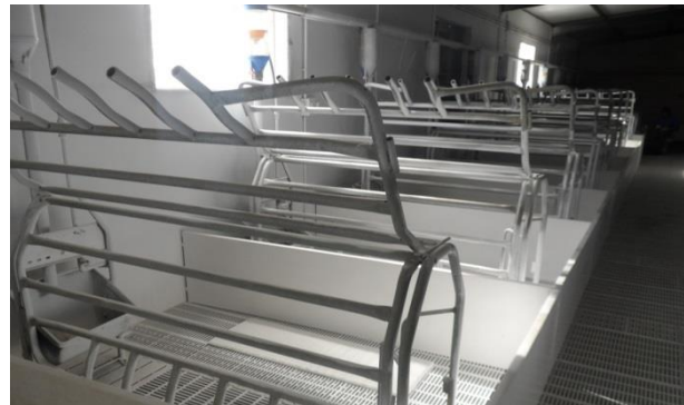
Horas después de usar DCal: