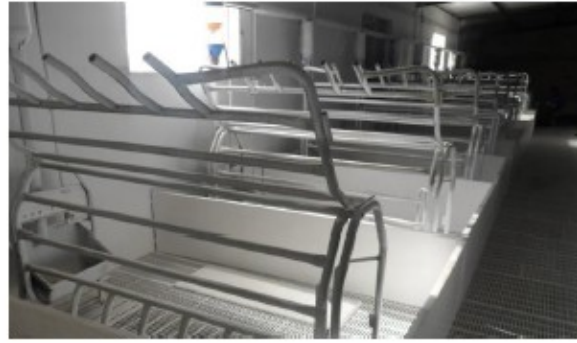
Horas después de usar DCal: