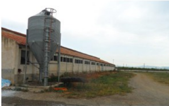
Antes de usar DCal: