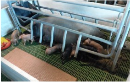
Antes de usar DCal: