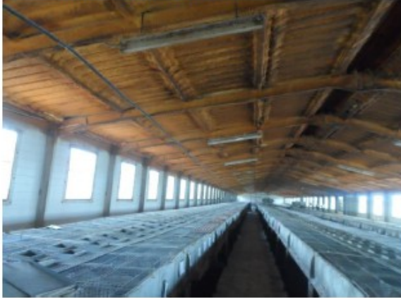
Antes de usar DCal: